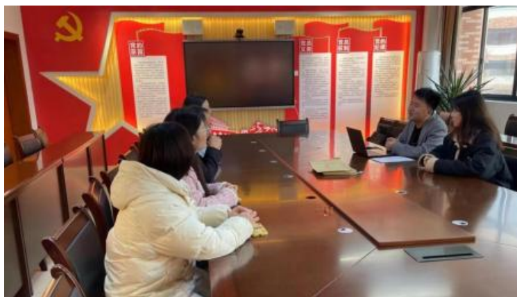
图 企开展学术 交 会