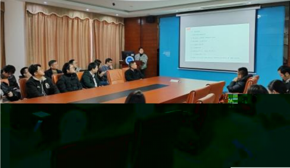
图 员工专业技 培