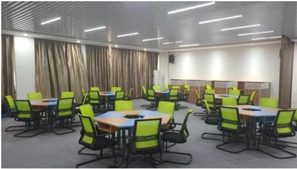
图 智慧 售 中心