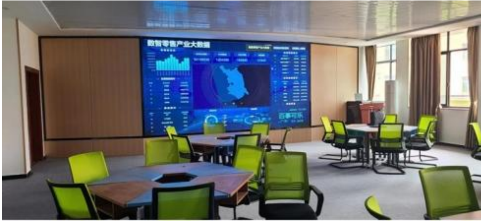
图 智慧 售 中心