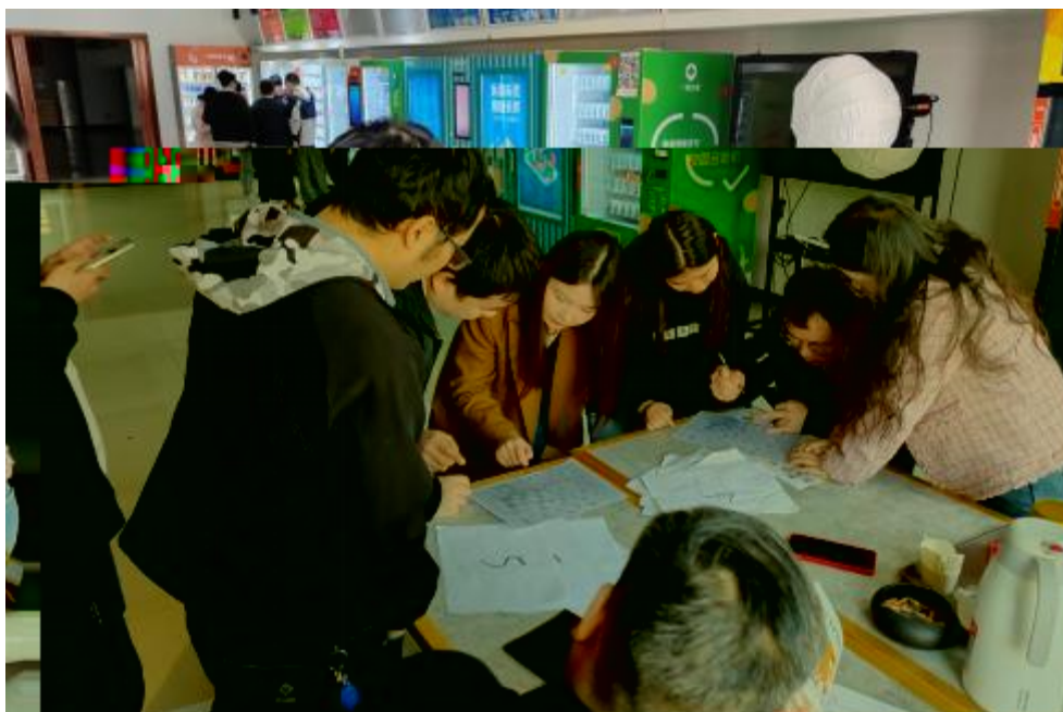
图 卓 团 建 共